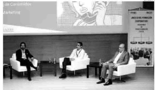
►► En CaixaForum ► Una de las sesiones de la jornada de ayer.