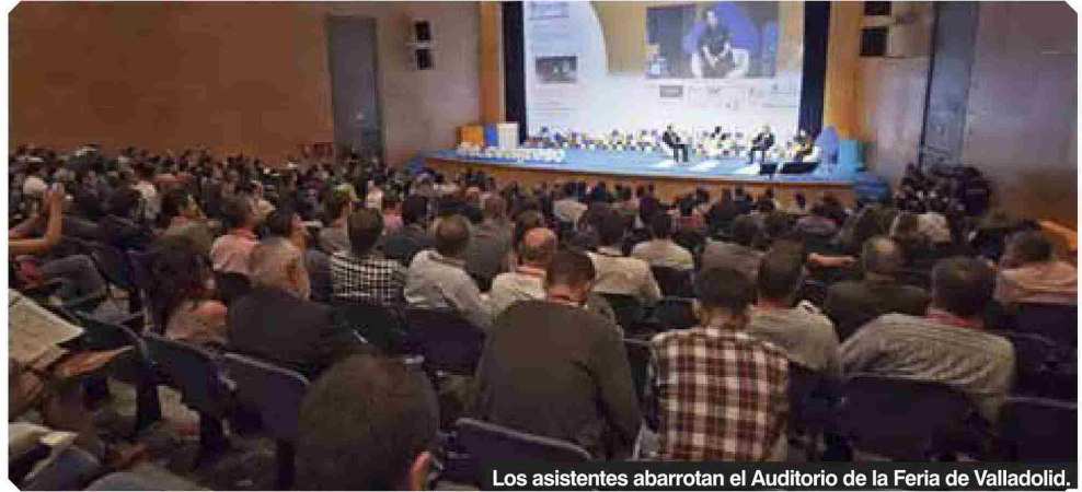
Los asistentes abarrotan el Auditorio de la Feria de Valladolid.