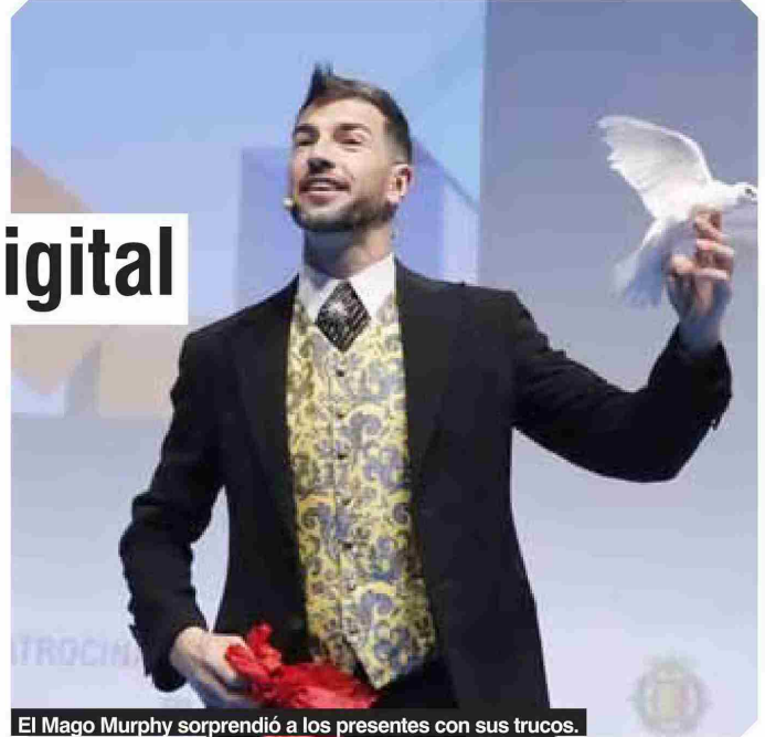
El Mago Murphy sorprendió a los presentes con sus trucos.

Diecisiete ponentes, cinco mesas redondas y cientos de tuits han convertido al Congreso e-volución en un hervidero de ideas