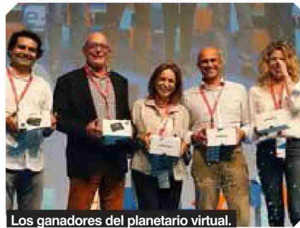
Los ganadores del planetario virtual.